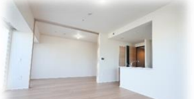
〈リビングダイニング〉