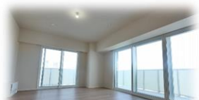
〈リビングダイニング〉